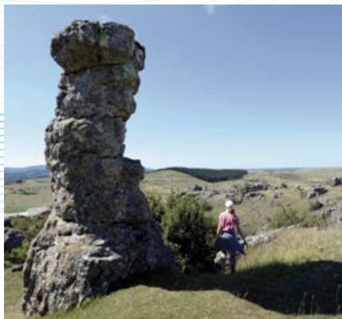
Nîmes le Vieux : ruiniformes acquis par karstification sous couverture au cours du Crétacé inférieur et du Tertiaire