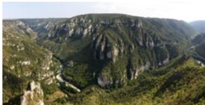
Illustration 2 : le massif présente sur toute sa hauteur de grands couloirs d'altération verticale

dans les couloirs d'altération puis permettre d'entraîner la couverture sédimentaire encore présente en surface. Ainsi, sur les bords des canyons apparaissent les couloirs d'altération qui affectent toute la hauteur du massif (Illustration 2).