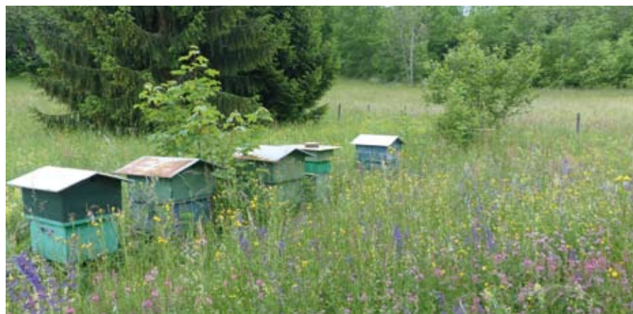
PNR du Massif des Bauges

Les jurys du concours évaluent la cohérence entre les propriétés agri-écologiques de la parcelle et son usage agricole. La méthode requiert donc des compétences dans les trois domaines suivants : agronomie/ fourrage, écologie/botanique et apiculture/faune sauvage.