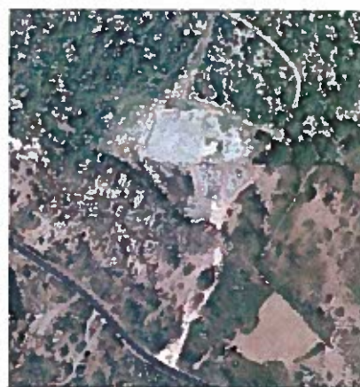
Paysage environnant →