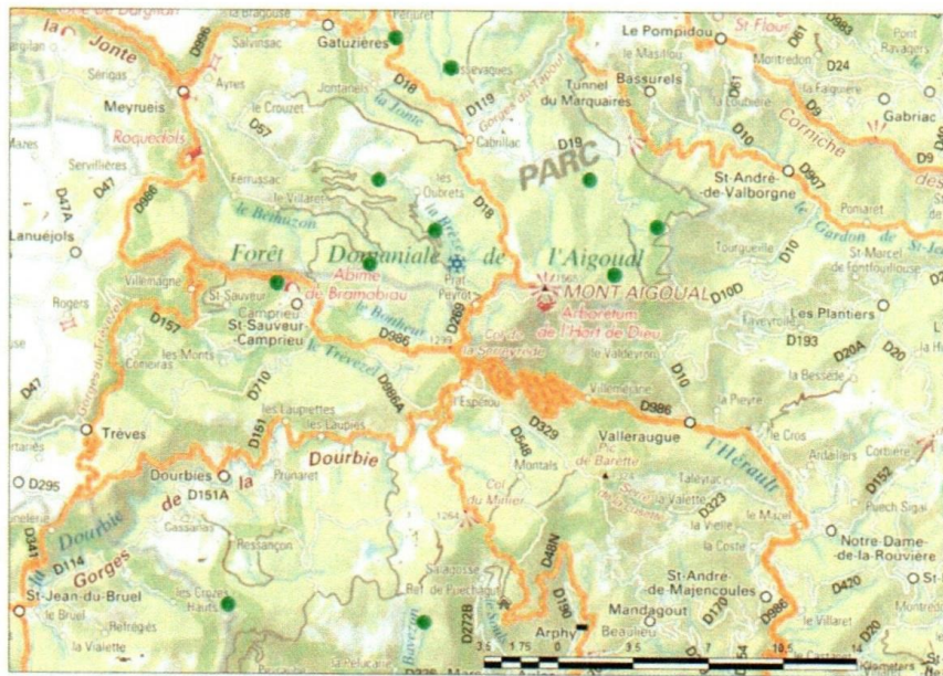
Figure 1. Carte de localisation des sites de capture au sein de l'Aigoual.